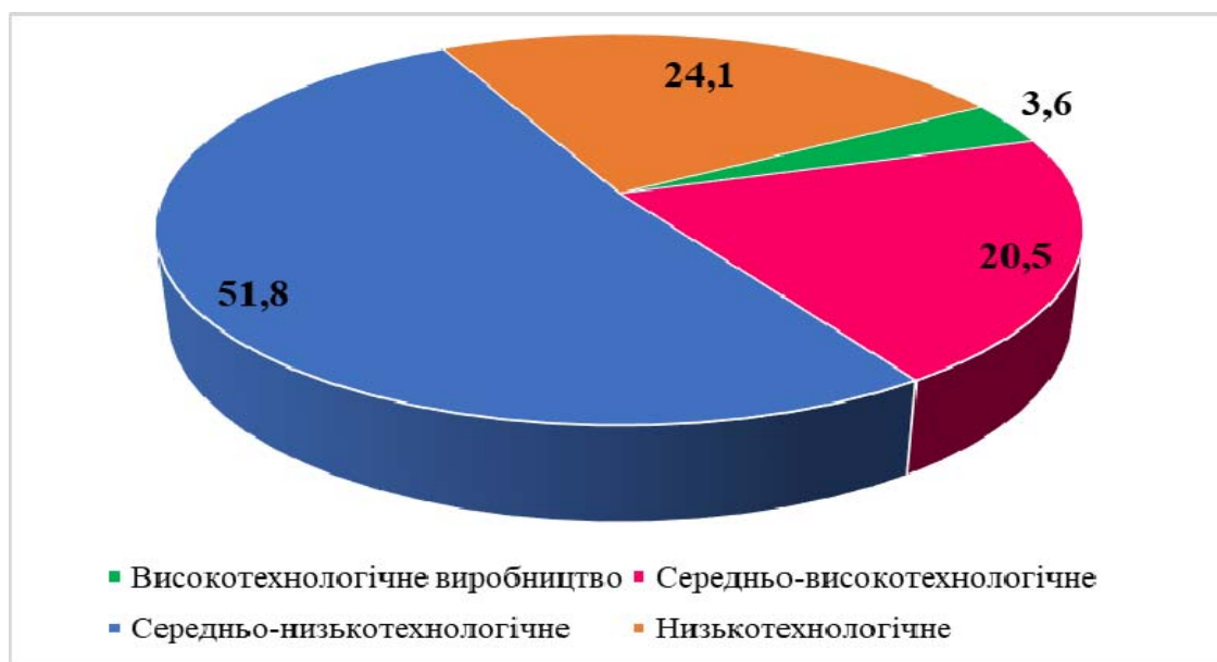
Рис. 2. Технологічна структура виробництва в Україні у 2021 р., %

Таким чином, можна стверджувати, що структурна перебудова економіки, яка ставить за мету збільшення темпів росту національної економіки, не обов'язково повинна орієнтуватися на розвиток промислового виробництва. Тобто, шлях, який пройшов Китай та інші країни Південно-східної Азії при побудові своїх експортно-орієнтованих економік не обов'язково спрацює сьогодні [3]. Тим паче, що тенденції сьогодення свідчать про необхідність забезпечення інноваційної складової у економічному зростанні. Мається на увазі, що розвиток інформаційних та цифрових технологій має наслідком системну трансформацію усієї економічної системи. При цьому виробництво технології приносить на порядок вищі доходи, ніж безпосереднє промислове виробництво. Тому, об'єктивною необхідністю в сучасних умовах є не просто трансформація структури національної економіки України, а саме інноваційна трансформація, орієнтована на ускладнення усієї економічної, в тому числі – і виробничої системи. Щоб оцінити поточну ситуацію з технологічною складністю промислового виробництва в Україні на даний час, розглянемо її структуру (рис. 2).