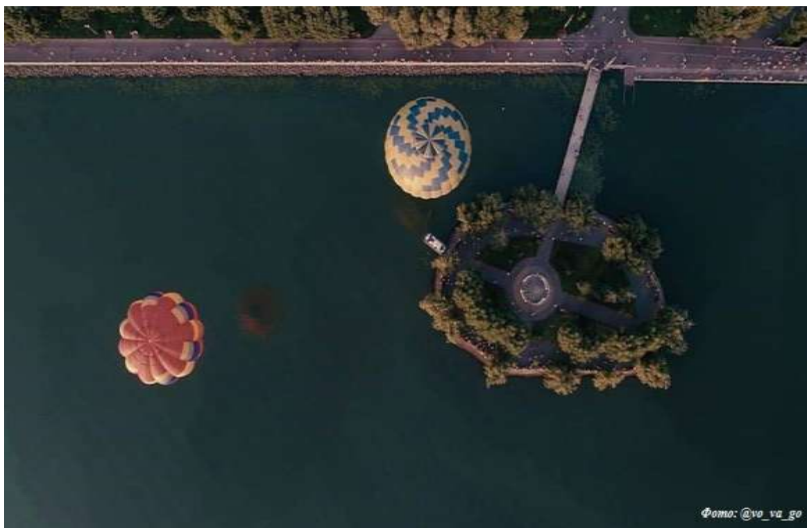
Рисунок 1.2. Острів закоханих

Найромантичнішим та найкрасивішим місцем що розміщене на цій набережні вважається Острів закоханих посеред Тернопільського ставу. Дістатись до Острова закоханих можна човном або по місточку, що з'єднує острів та парк.