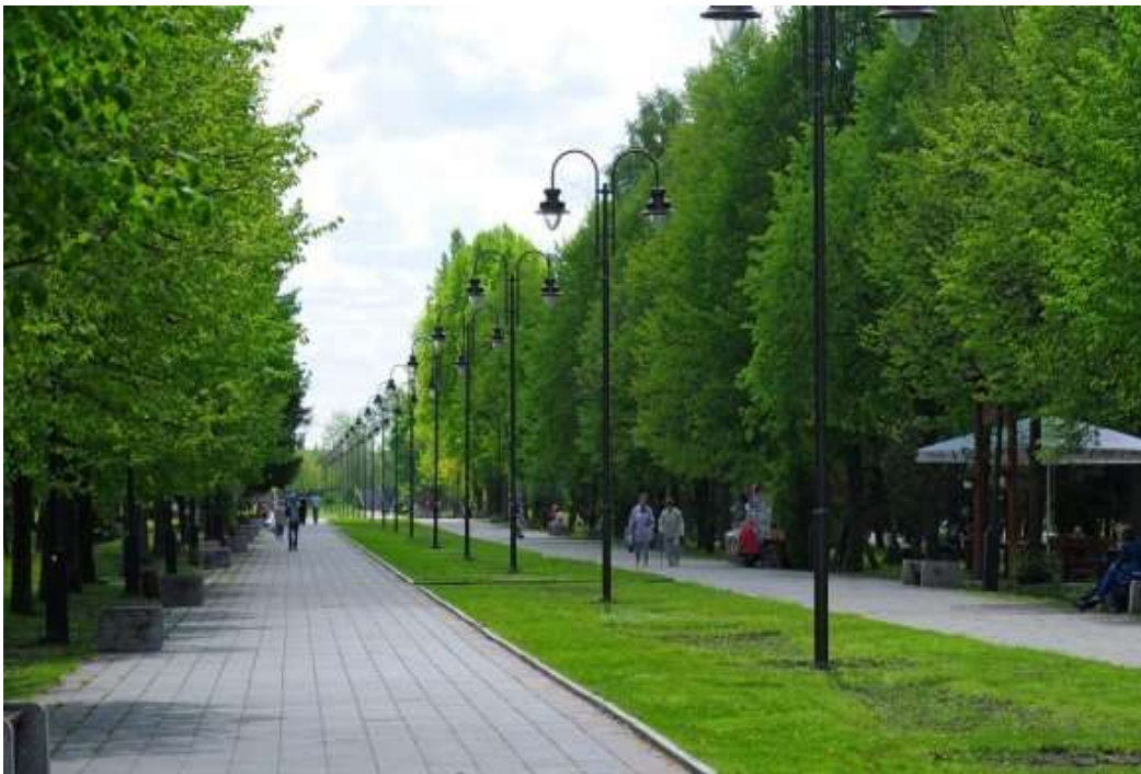
Рисунок 3.2. Парк імені Лесі Українки

Оцінка якості утримання зелених насаджень може бути проведена за допомогою різних критеріїв, які включають такі аспекти, як вигляд, здоров'я та стан рослин, якість ґрунту, наявність шкідників та хвороб, а також загальний естетичний вигляд місцевості. Чистота та порядок: Місця, де розташовані зелені насадження, повинні бути чистими та організованими, без сміття, сухих листя або інших небажаних матеріалів. Зрошення та полив: Рослини мають отримувати достатню кількість води, щоб забезпечити їх здоров'я та вигляд. Добрива та догляд за ґрунтом: Ґрунт повинен бути відповідно добре дренованим та достатньо живленим, а також підтримувати оптимальний рівень родючості. Відповідність місцевим кліматичним умовам: Рослини мають бути підібрані відповідно до кліматичних умов регіону, де вони ростуть, для забезпечення їхнього [8].