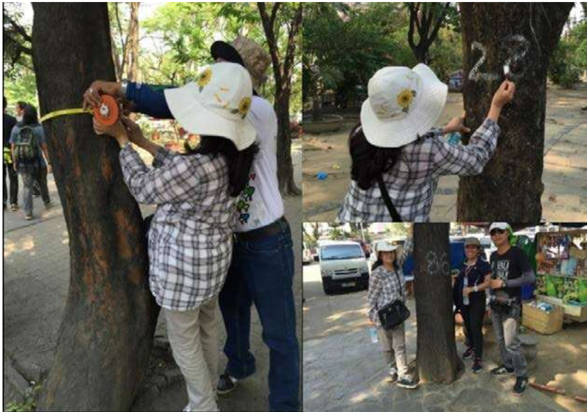
Рисунок 3.1.Інвентаризація зелених насаджень

мешкають на інвестиційній території. Саме завдяки цьому документу ми можемо визначити, які породи мешкають на прилеглих деревах чи кущах, які збираються вирубати. У вибраних для термомодернізації будівлях також можуть жити деякі птахи. Орнітологічну зйомку готує кваліфікований орнітолог. Документація необхідна для отримання дозволу від регіонального управління охорони навколишнього середовища. Завдяки цьому ми можемо уникнути знищення місць гніздування птахів. Метою обстеження є опис об'єктів, тобто дерев і чагарників, призначених для вирубки або реконструкції. До основних характеристик насаджень відносяться такі елементи, як порода і діаметр по висоті (діаметр дерева по висоті 130 см). Крім того, реєструється зріст і стан здоров'я, а також, можливо, діаметр крони або наявність пташиних гнізд. Для чагарників замість ДБН вказується площа в квадратних метрах.