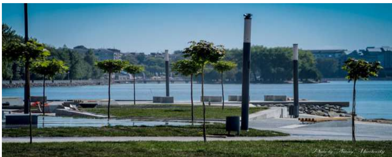
Рисунок 1.1 Тернопільська набережна

Атмосфера біля входу в парк та на причалі зазнала значних змін. Колись тут була асфальтова доріжка, але після реконструкції її замінили на бруківку. На бруківці вибув герб міста, а також з'явилися велосипедні доріжки та нові дерева. Старий кіоск був знесений, але на його місці з'явилися нові, де можна придбати морозиво, вуличну їжу та напої. Були встановлені нові лавки та "сонячні дерева", що дозволяють заряджати телефони. Біля самого ставу колись працював "Великий фонтан", який у 2012 році було переміщено до водойми навколо острівця "Чайка". Тепер вздовж ставу розташовані аераційні фонтани, які ввечері підсвічуються різними кольорами.