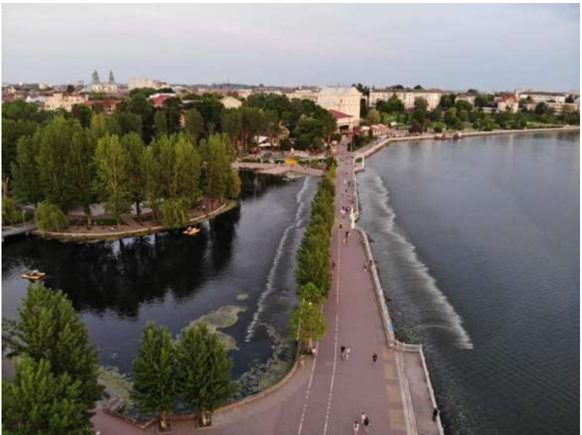
Рисунок 1.3. Тернопільські фонтани