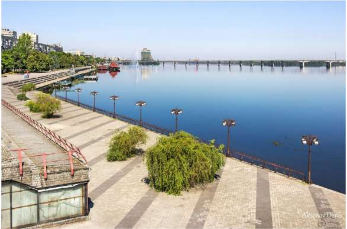
Рисунок.1.5. Беттері-Парк-Сіті, Нью-Йорк

У 1962 році муніципалітет вирішив оживити простір портової зони, яка охоплює 54 гектари, і затвердив план ревіталізації. Старі причали були знесені для розширення берегової лінії, а вже у 1983 році тут був зведений перший житловий комплекс. Зараз уздовж всього берега простягається набережна з пристанями для яхт і паромними переправами. Близькість до Волл-стріт зробила цей район популярним серед банкірів, що призвело до швидкого заселення району. Зараз населення району становить 13 тисяч осіб, а середня орендна плата за житло складає близько 2800 доларів, що вдвічі більше, ніж у середньому по місту. У вихідні район стає менш оживленим, але місцеві мешканці та туристи продовжують відвідувати багатоповерховий торговий центр "Брукфілд Плейс" і кататися на велосипедних доріжках парку, що розташовані на березі річки [1].