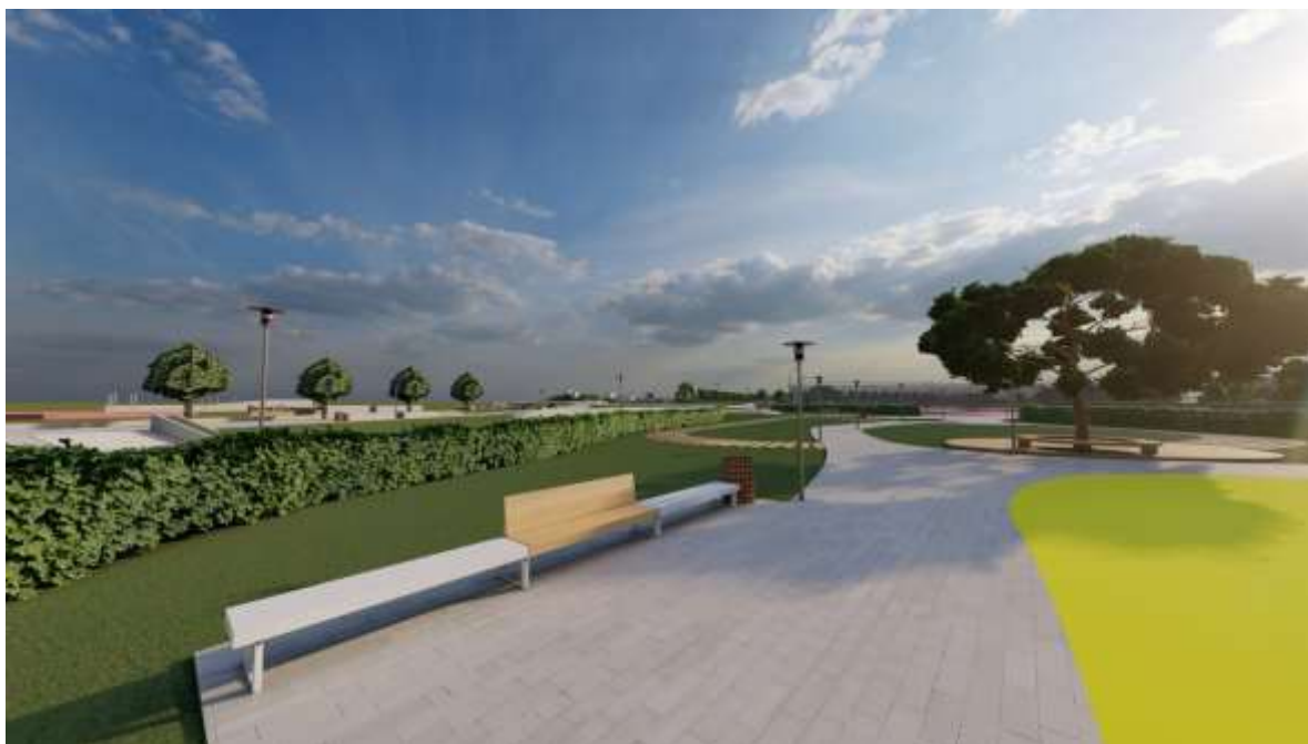
Рисунок.4.2 Пропозиція створення дизайну лавки

Отже, з дотриманням норм екології та експлуатації, було продумано низку певних процесів для створення всіх зручностей в користування[12].