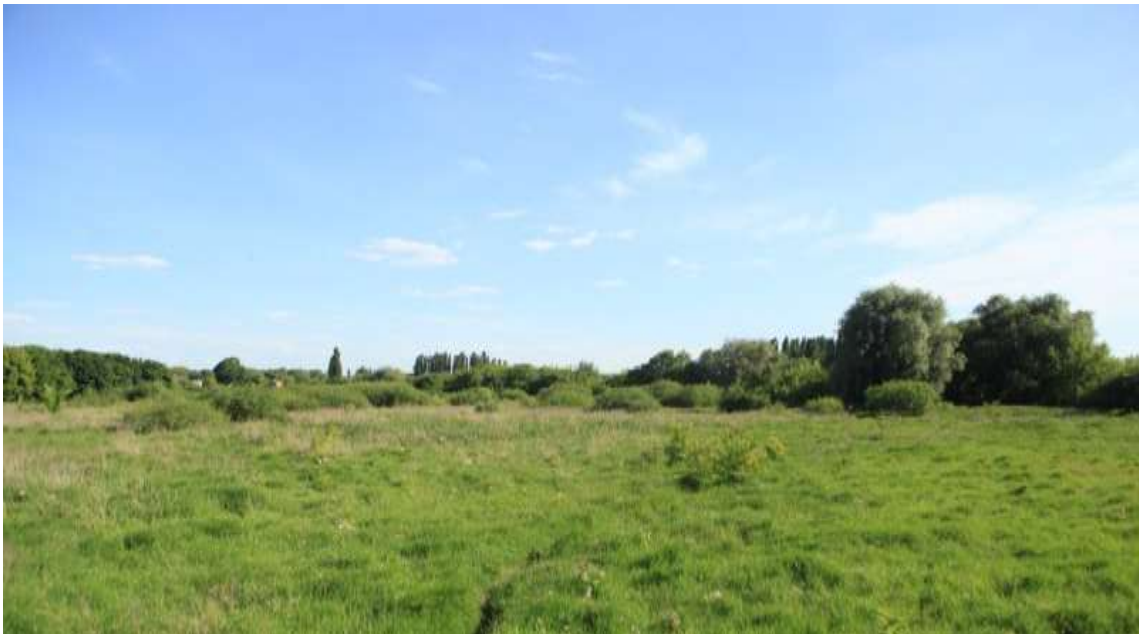
4.1. Існуючий стан ділянки

Аналіз існуючого стану ділянки має такий вигляд: 1) заболочена місцевість без належного доступу до води; 2) має велику ділянку для розміщення даного проектного плану; 3) також дана територія знаходиться біля міської забудови та архітектурних пам'яток сучасності як Будинок скульптора Голованя і Церква «Дім Євангелія»; 4) біля нашої набережної знаходиться ще невеликий острівцець який має свою фауну і флору.