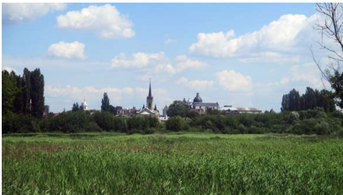
Рисунок 1.8. Гнідавське болото

Впровадження заходів, передбачених у Програмі, сприятиме реалізації концептуальних принципів формування екологічного каркасу міста та відновлення природного стану його складових на перспективу. Зі стирем в межах Луцька тісно пов'язане й «Гнідавське болото» – загальнозоологічний заказник місцевого значення, створений з метою збереження частини заболоченої лівобережної заплави річки Стир. Тут зростають: рогіз широколистий, очерет звичайний, осока, верба біла.