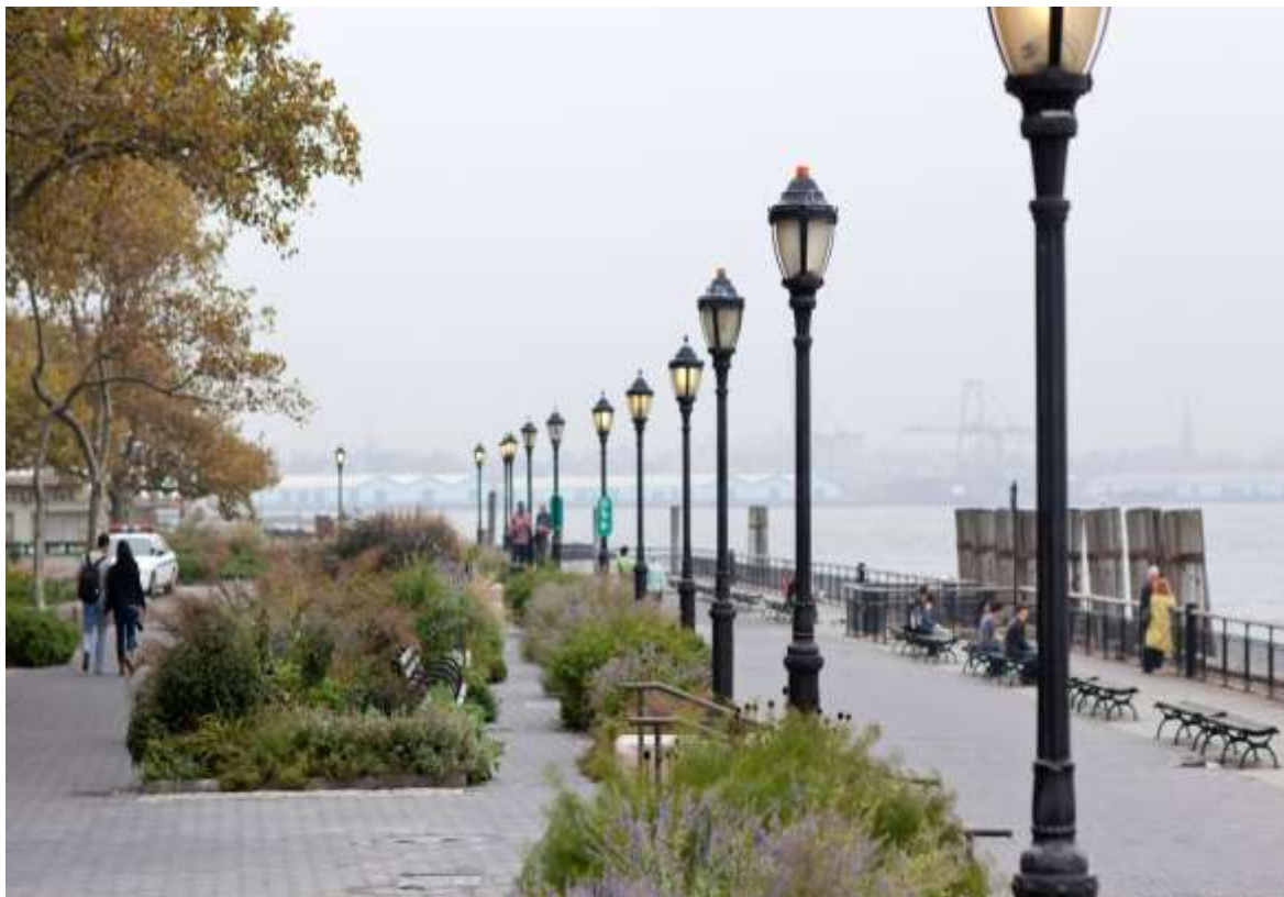
Рисунок 1.6. Центральна набережна, Торонто

Центральна набережна Торонто, розташована у діловому серці міста, пройшла значні зміни через реконструкції. У 60-х роках минулого століття була прокладена швидкісна траса вздовж набережної, і промислові підприємства, які колись розміщувалися на узбережжі, були переміщені за межі міста. З появою офісних центрів наприкінці того ж століття, набережна була розділена на кілька відокремлених частин.