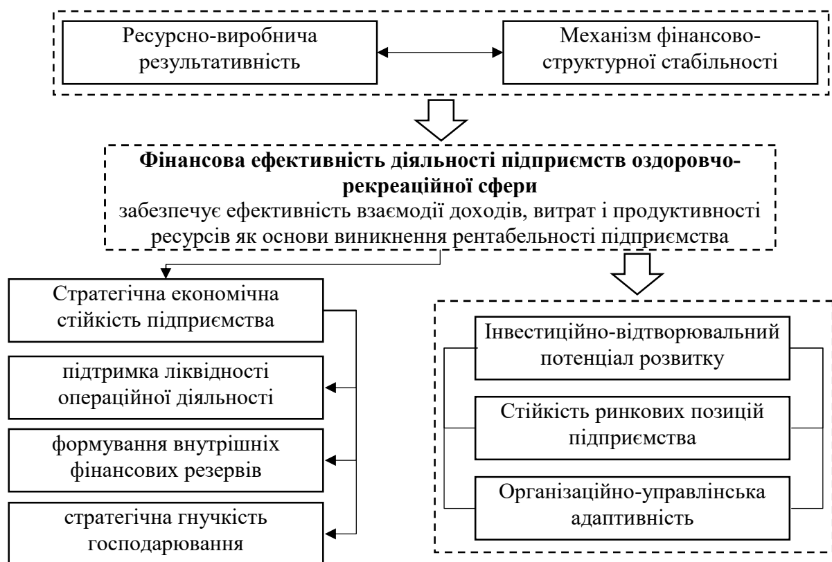
Рис. 2. Концептуальна модель аналітичної інтерпретації механізмів впливу економічних детермінант на рентабельність діяльності підприємств оздоровчо-рекреаційної сфери

Відповідно, у своїй сукупності дані фактори утворюють взаємопов'язану систему впливів, коли доходи формують результативну основу, витрати – обмежувальний контур, ресурсна продуктивність визначає ефективність операційного використання активів, а фінансова структура задає параметри стабільності та ризику. Така взаємодія дозволяє комплексно пояснити механізми формування фінансових результатів підприємств оздоровчо-рекреаційної сфери на засадах формування концептуальної схеми їх аналітичної інтерпретації (рис. 2).