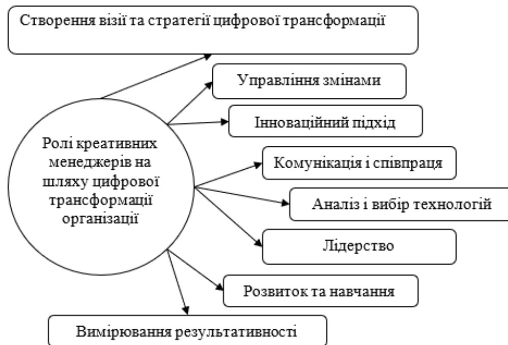
Рис. 2. Ролі креативних менеджерів на шляху цифрової трансформації організації

Управління змінами – завданням креативних менеджерів є ефективне управління змінами, пов'язаними з впровадженням цифрових ініціатив. Вони вміють адаптувати команду до нових умов, забезпечуючи при цьому підтримку від персоналу, мінімальні втрати продуктивності та формуючи позитивне ставлення до інновацій.