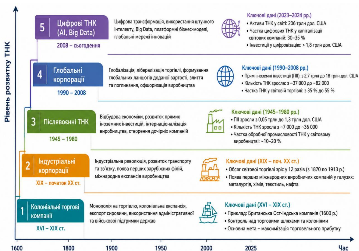
Рисунок 1.1 Еволюція розвитку ТНК

За даними OECD, понад 60% світової торгівлі прямо або опосередковано пов'язані з діяльністю ТНК [21].