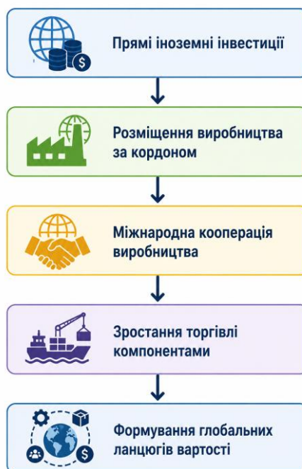
Рисунок 2.4 Взаємозв'язок ПІІ та міжнародної торгівлі

Міжнародна торгівля та інвестиційні процеси в діяльності ТНК є взаємопов'язаними та взаємозалежними. Прямі іноземні інвестиції часто супроводжуються збільшенням товарообміну між країнами, особливо у сфері комплектуючих, сировини та технологій. На рисунку 2.4 схематично зображено взаємозв'язок ПІІ та міжнародної торгівлі