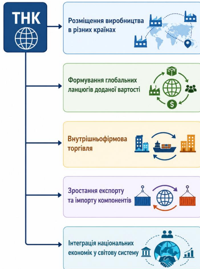
Рисунок 2.3 Механізм впливу ТНК на міжнародну торгівлю

глобальному масштабі. Інноваційна інфраструктура, створена за участі ТНК, сприяє розвитку національних інноваційних систем, підвищує рівень кваліфікації кадрів та стимулює науково-технічний прогрес. На рисунку 2.3. графічно зображено механізм впливу ТНК на міжнародну торгівлю.