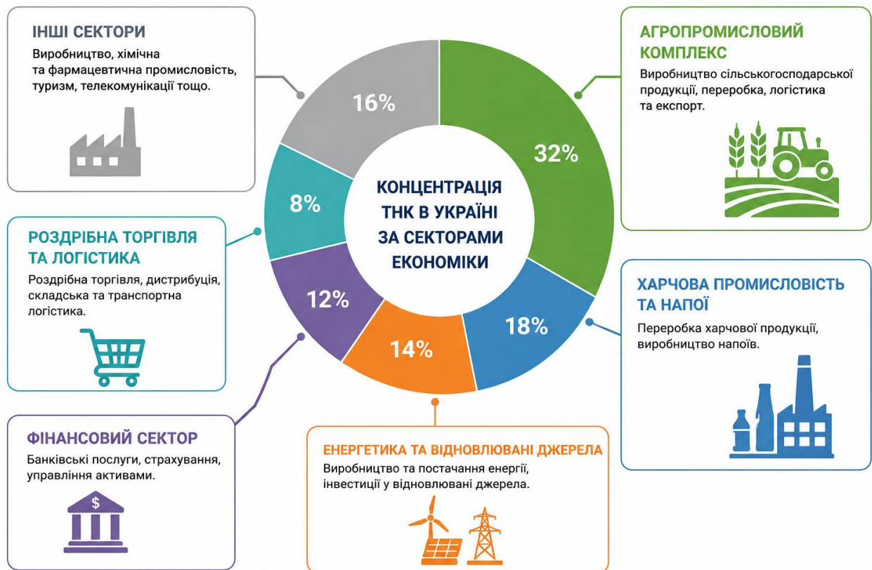
Рисунок 2.5 Концентрація ТНК в Україні за секторами економіки станом на 01.01.2024 р.