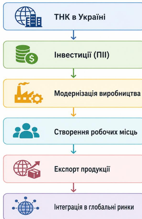
Рисунок 2.6. Вплив ТНК на економіку України

Не менш важливим є впровадження сучасних технологій та інновацій. Це позитивно впливає на модернізацію національної економіки, підвищення продуктивності праці та конкурентоспроможності українських підприємств. На рисунку 2.6 схематично зображено вплив ТНК на економіку України.