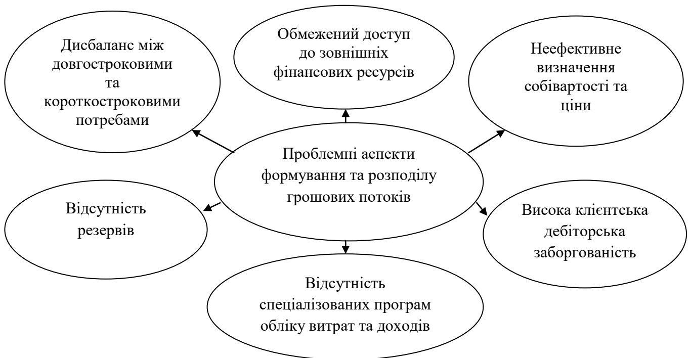
Рисунок 1 – Проблемні аспекти ефективного формування та розподілу грошових потоків підприємств малого бізнесу*

Усі проблемні аспекти в напрямку ефективного формування та розподілу грошових потоків відображено на рисунку 1.