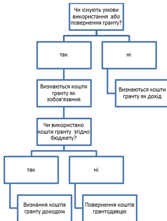
Рис. 2 – Визнання гранту в обліку