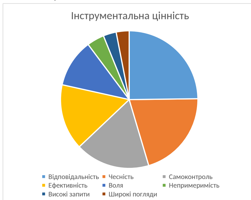
Рис. 2.3. Інструментальні цінності

місце: у психологічній літературі він розглядається як один із ключових механізмів адаптації до хронічного стресу [15; 21]. Незначущими виявилися «Непримиренність до недоліків», «Високі запити» та «Широта поглядів» - цінності, що вимагають рефлексивного та вимогливого ставлення до себе й інших, неможливого за умов виживання.