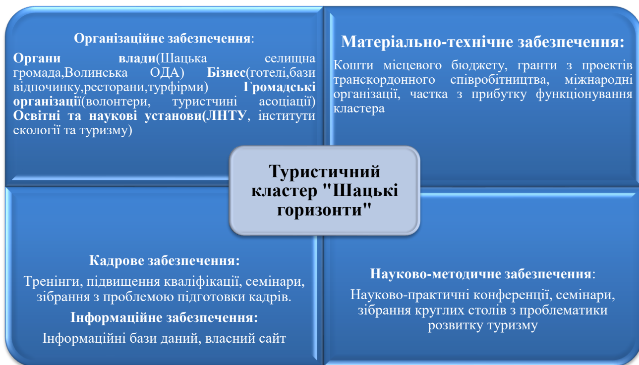
Рисунок 3.2. Забезпечення туристичного кластеру «Шацькі горизонти»