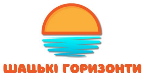
Рисунок 3.1. Логотип туристичного кластеру «Шацькі горизонти»

Шацька територіальна громада – одна з найбільш розвинутих міських громад у Волинській області. Загальна кількість населення 17898 осіб: міське населення – 8477 осіб (47,3%) та сільське населення – 9421 осіб (52,7%). Площа – 948 км 2 , 35 населених пунктів. Вона вражає своїм багатим історичним минулим і казковими краєвидами. Перша літописна згадка про Шацьк датується 1545 р. У 1554 р. м. Шацьк отримало магдебурзьке право. У цьому році місто буде відзначати 480-річчя. Громада розташована на півночі Волинської області, між річками Стохід і Прип'ять. Відстань до обласного центру м. Луцька – 95 км. На території громади 20 річок, 30 озер, 35 об'єктів природно-заповідного фонду загальнодержавного. Добре збережено автентичну культуру Волині, звичаєві та обрядові характеристики і неймовірні природні ландшафти. Шацька громада – одна з небагатьох, де спостерігається позитивний приріст населення. До кластеру можуть долучитися всі зацікавлені суб'єкти туристичної сфери, громадські організації, інші зацікавлені особи тощо.