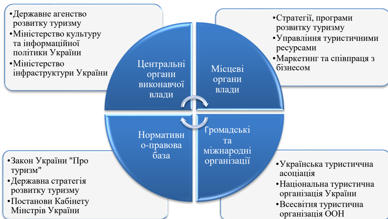
Рисунок 1.1 Інституційне забезпечення розвитку туризму України

Законодавство дозволяє забезпечити відповідність послуг певним стандартам і мінімізувати ризики для туристів. Одночасно з цим, виконувати функцію захисту прав споживачів туристичних послуг. Це передбачає не лише розгляд скарг і конфліктних ситуацій, а й створення умов, у яких споживач почуватися впевнено й безпечно. Туристична сфера не може функціонувати без ефективної ролі держави, яка виступає не лише як регулятор, але й як партнер, інвестор, гарант і стратегічний координатор. Одна з ключових функцій держави – нормативно-правове регулювання. Саме вона формує законодавче «поле», в межах якого діють суб'єкти туристичного ринку. Вона встановлює всі правила, які забезпечують правову визначеність, прозорість діяльності та захист інтересів усіх учасників туристичного бізнесу. Без чітко сформованої правової бази індустрія ризикує залишитись у тіні або потрапити під недобросовісний вплив [22]. Основні інституції регулювання туристичної діяльності можемо переглянути на рисунку 1.1.