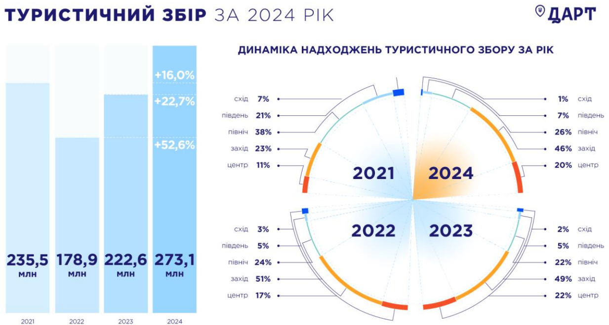
Рисунок 2.3. Динаміка надходжень туристичного збору за 2021-2024 рр.

Туризм завжди відігравав важливу роль у формуванні бюджету України. Ця сфера стимулює зростання багатьох компонентів інфраструктури, зокрема комерційних установ, заклади харчування тощо. Проте, з початку вторгнення росії, індустрія в Україні передбачувано різко зазнала спаду. Початковий інтерес з боку іноземних журналістів і політичних делегацій, які відвідували країну після вторгнення поступово зменшився. Україна зіткнулася із чергою з викликів: закриті авіасполучення, політична нестабільність, фінансові труднощі та нестабільна безпекова ситуація. Попри це, український бізнес продовжує функціонувати, приносячи країні економічну вигоду. Україна звикає до нової реальності, старається відроджуватись та розвивати свій особистий туристичний бренд, про що свідчить туристичний збір у 2024 році (рис. 2.3).