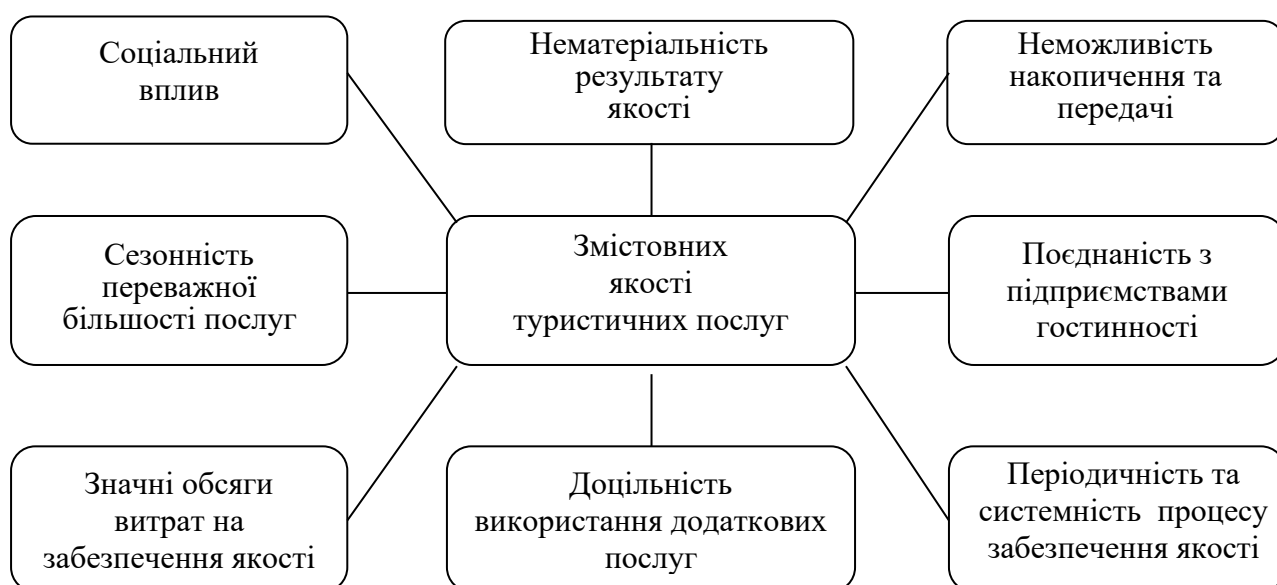
Рис. 1.1. Структура змістовних ознак якості туристичних послуг [25]

виміряти та оптимізувати рівень задоволення споживачів. Чітке розуміння того, що формує якість послуг, таких як комфорт, доступність, надійність та персоналізація, допомагає туристичним компаніям розробляти відповідні стандарти обслуговування, які відповідають очікуванням та перевагам споживачів [24]. Зазначене, в свою чергу, не тільки покращує загальне сприйняття бренду та сприяє повторному вибору та рекомендаціям з боку споживачів, але й забезпечує конкурентну перевагу на ринку, насиченому різноманітними пропозиціями. Чітке визначення і систематичне впровадження ознак якості є фундаментом для сталого розвитку та зростання в сфері туристичних послуг (рис. 1.1).