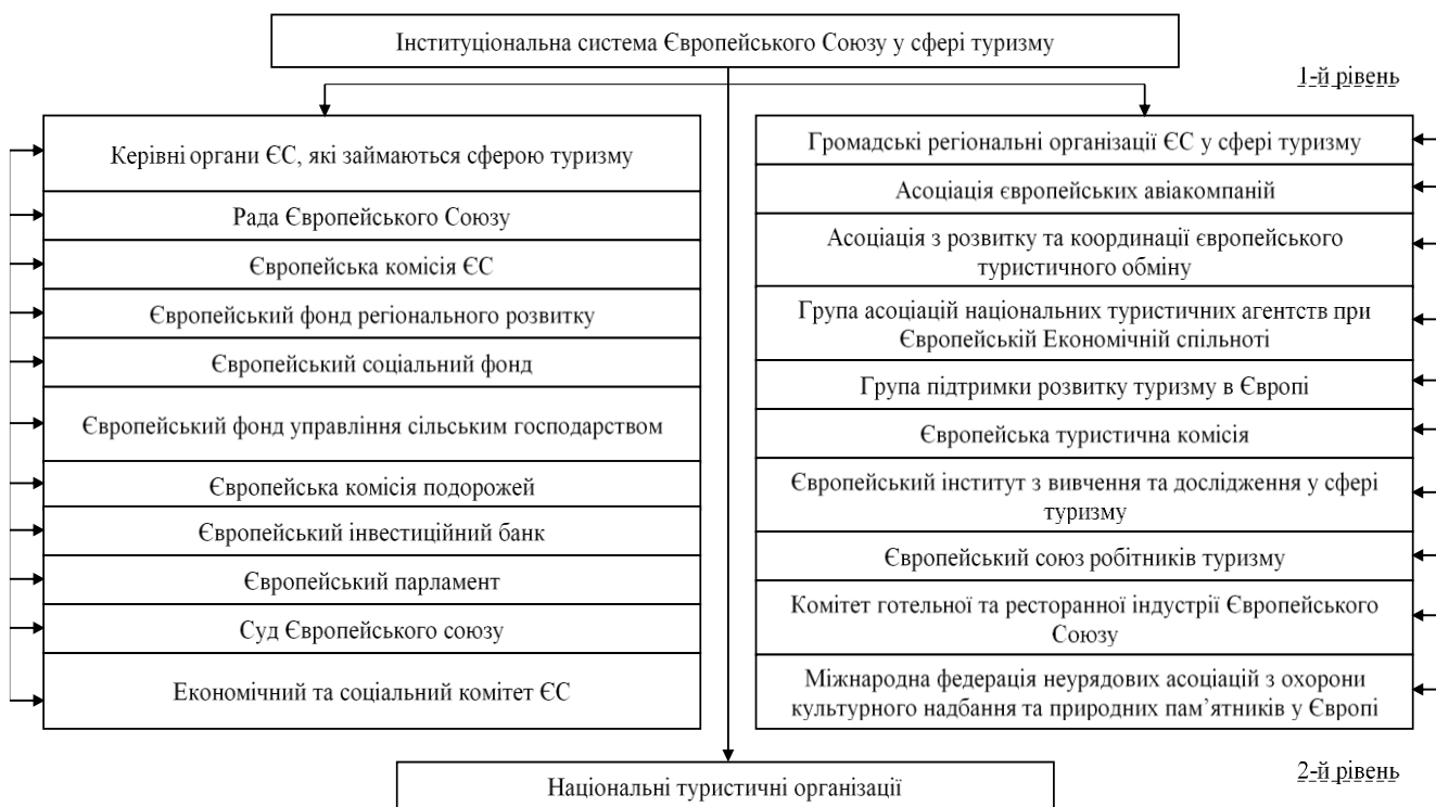
Рис. 1.2. Інституціональна система ЄС у сфері індустрії туризму.

Туристичні об'єднання використовують ці ініціативи для координації та співпраці на регіональному і міжнародному рівнях, сприяючи транскордонним туристичним проектам та маркетингу. Європейські фонди, як наприклад, Європейський фонд регіонального розвитку, забезпечують фінансування для покращення інфраструктури та культурних ініціатив, що безпосередньо застосовується в туристичному секторі і допомагає об'єднанням розширювати та покращувати свої послуги. Крім того, політика ЄС щодо спрощення візових процедур та регулювання авіаційного простору забезпечує збільшення туристичних потоків, що є важливим для туристичних об'єднань, орієнтованих на залучення міжнародних відвідувачів. Інституціональна система ЄС у сфері індустрії туризму представлена на рис. 1.2.