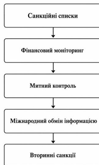
Рисунок 1.5 Система контролю за виконанням міжнародних санкцій

Особливе значення мають вторинні санкції, які застосовуються щодо третіх сторін, що співпрацюють із державою або компаніями, які перебувають під санкціями. Українські автори наголошують, що вторинні санкції значно підвищують ефективність санкційної політики, але одночасно створюють ризики для міжнародної торгівлі та глобальної економічної стабільності [17]. На рисунку 1.5 подано систему контролю за виконанням міжнародних санкцій.