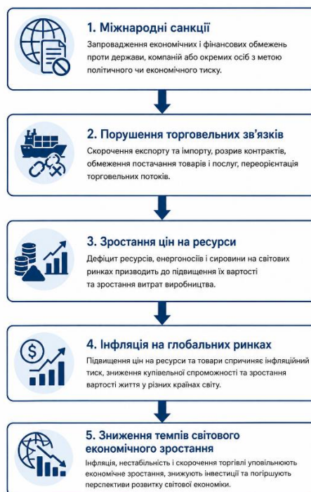
Рисунок 2.4 Вплив міжнародних санкцій на глобальні ринки