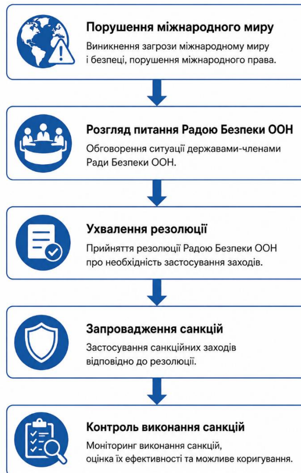
Рисунок 1.4 Механізм застосування санкцій ООН

Після завершення Холодної війни санкції ООН стали застосовуватися значно активніше. Особливо це стосується санкційних режимів щодо Іраку, Ірану, Північної Кореї, Лівії та інших держав. На рисунку 1.4 подано механізм застосування санкцій ООН.