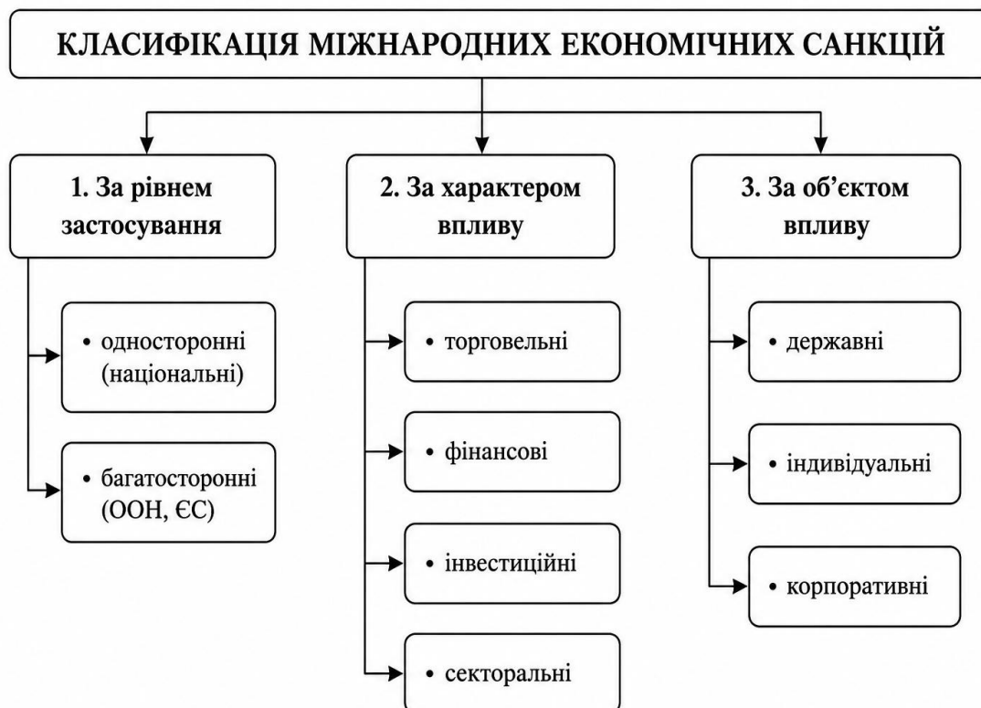
Рисунок 1.1 Класифікація міжнародних економічних санкцій

У сучасній практиці санкції класифікуються за різними критеріями. Її класифікацію подано на рисунку 1.1.