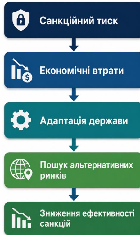
Рисунок 2.5 Обмеження та наслідки міжнародних санкцій

Одним із найбільш дискусійних аспектів санкційної політики є гуманітарний вплив санкцій на населення. Комплексні економічні санкції можуть спричиняти дефіцит товарів, зростання цін, скорочення доходів населення, проблеми у сфері охорони здоров'я та погіршення соціальної ситуації. На рисунку 2.5 подано обмеження та наслідки міжнародних санкцій