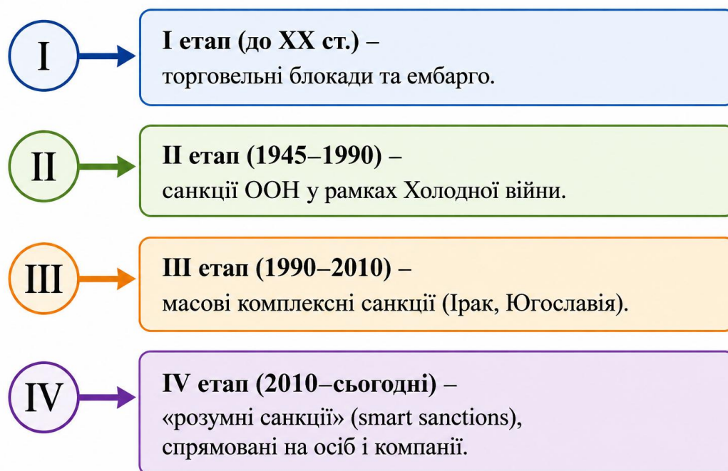
Рисунок 1.2 Еволюція міжнародних економічних санкцій