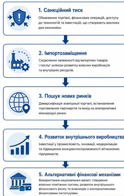
Рисунок 2.1 Основні напрями адаптації економіки до санкцій