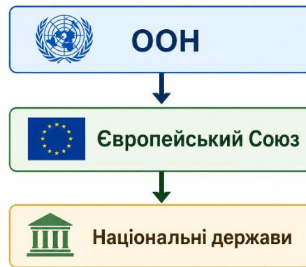
Рисунок 1.3 Рівні застосування міжнародних санкцій

Сьогодні санкції застосовуються трьома основними рівнями, що подано на рисунку 1.3.