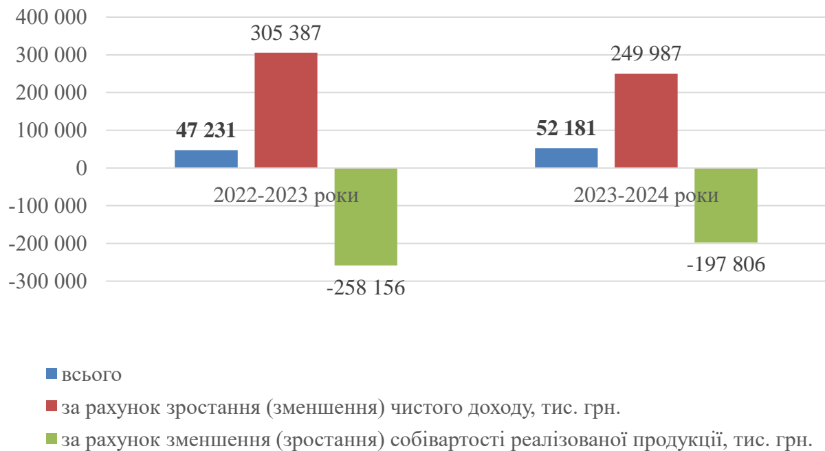
Рис. 2.1. Порівняння впливу факторів на зміну валового прибутку підприємства за 2022-2024 роки

Надалі проведено порівняння впливу факторів на зміну валового прибутку підприємства за 2022-2024 роки (рис. 2.1).