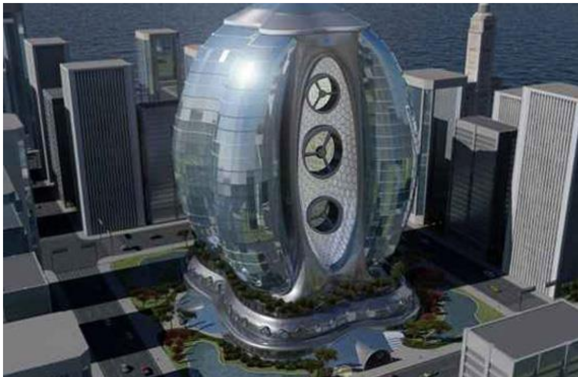
Рис. 2.4. Еко-готель Envision Green Note

В американському штаті Флорида незабаром збудують черговий готель екоіндустрії (рис. 2.4).