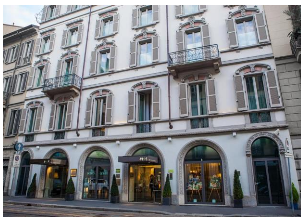
Рис. 2.1. Готель «Hotel Scala» (Італія)

Свого часу найкращі еко-готелі світу були відкриті у Швейцарії, Великій Британії, Чехії та ПАР. Велика кількість іноземних готельних мереж та готелів вводять екологічну концепцію діяльності, розробляючи різні інноваційні проекти економії ресурсів та охорони навколишнього середовища. Наприклад, у Словаччині існує цілий екологічний курорт AquaCity. Весь комплекс якого використовує сонячну та вітрову енергію для опалення приміщень готелів,