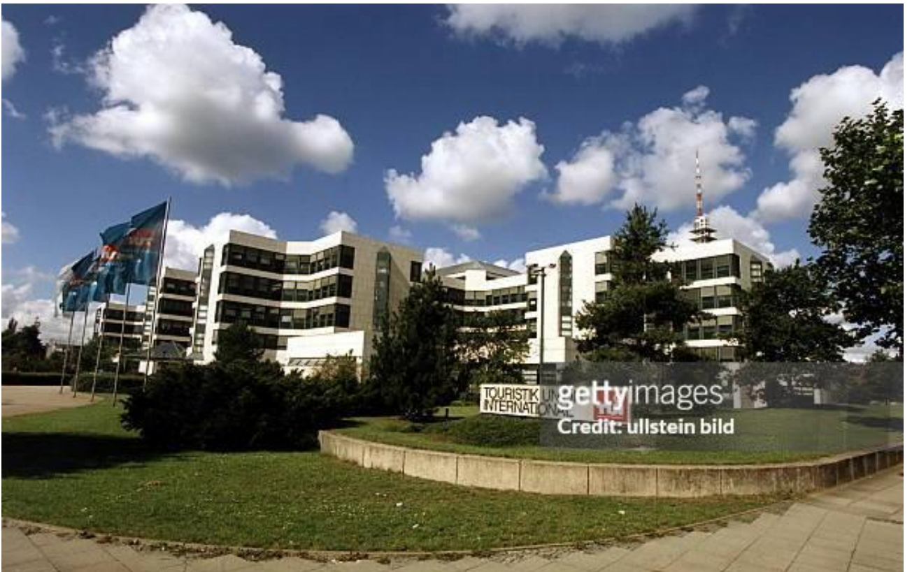
Рис. 1.3. Готель Touristik Union International (Німеччина)