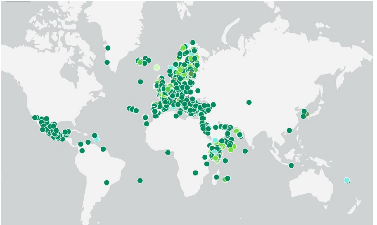
Рис. 1.2. Дислокація готелів світу які мають сертифікацію «Green Key»