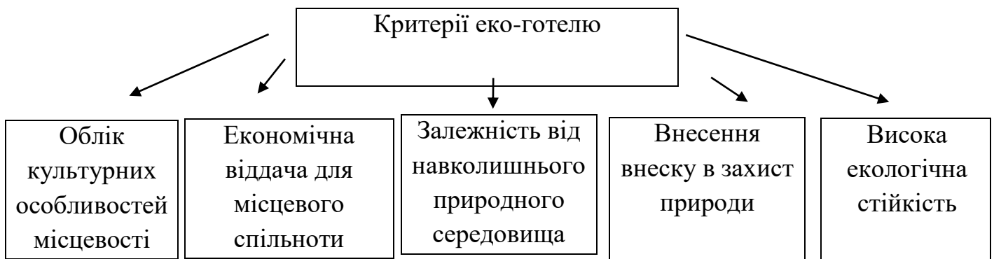
Рис. 2.5. Критерії еко-готелю

Основні критерії еко-готелю наведено на рисунку 2.5.