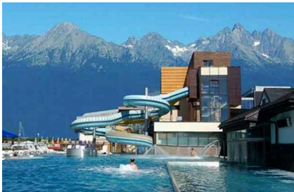
Рис. 2.3. Курорт AquaCity (Словаччина)

У Словаччині є цілий екологічний курорт AquaCity. Весь комплекс використовує сонячну та вітрову енергію для опалення готелів, аквапарку, СПА, ресторанів, барів, фітнес-залів та конференц-холів. Кожен гість впевнений у тому, що через нього довкілля не постраждає (рис. 2.3).