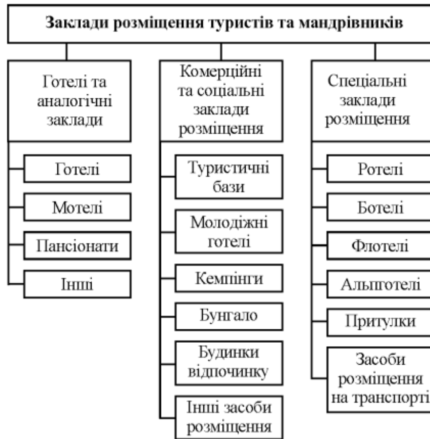
Рис. 1.1. Класифікація засобів розміщення [16]

Екологічний менеджмент – це сукупність принципів, форм, методів, прийомів та засобів управління виробництвом та персоналом з метою досягнення економічної ефективності виробництва та екологічної цілісності щодо сталого розвитку. Згідно наведеному визначенню, екологічний менеджмент можна визначити як комплекс заходів, що охоплюють управління ресурсами, виробничими процесами та продукцією та спрямовані на зменшення негативних впливів виробничої діяльності на довкілля та підвищення ефективності роботи підприємств. Одним із головних елементів системи екологічного менеджменту, що ефективно функціонує, є аналіз проведеної та планування майбутньої діяльності [1, 9, 18-22].