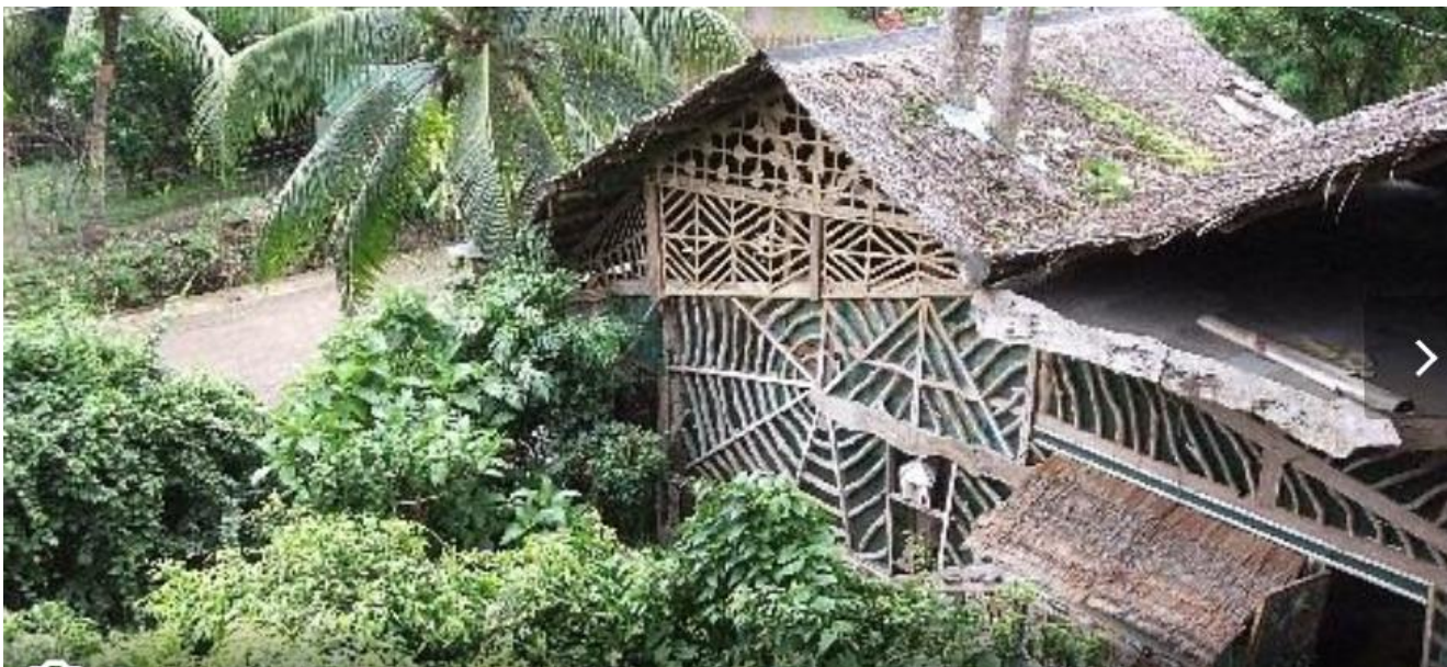
Рис. 2.2. Enigmata Treehouse Ec lodge (Філіппіни)

засинаючи і приймаючи їжу на деревах з видом на океан в оточенні білих піщаних пляжів (рис. 2.2).