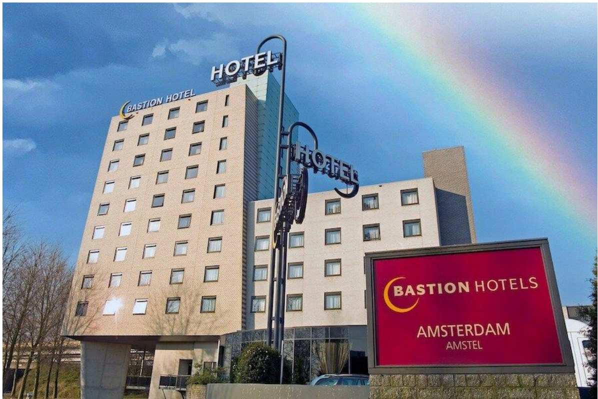
Рис. 1.4. Готель Green Globe (Велика Британія)

Екомаркування готелів в Європі — це система сертифікації та визнання готелів, які дотримуються високих стандартів екологічної сталості та соціальної відповідальності. Це дозволяє гостям легше визначити готелі, які приділяють увагу питанням збереження довкілля та сталого розвитку.