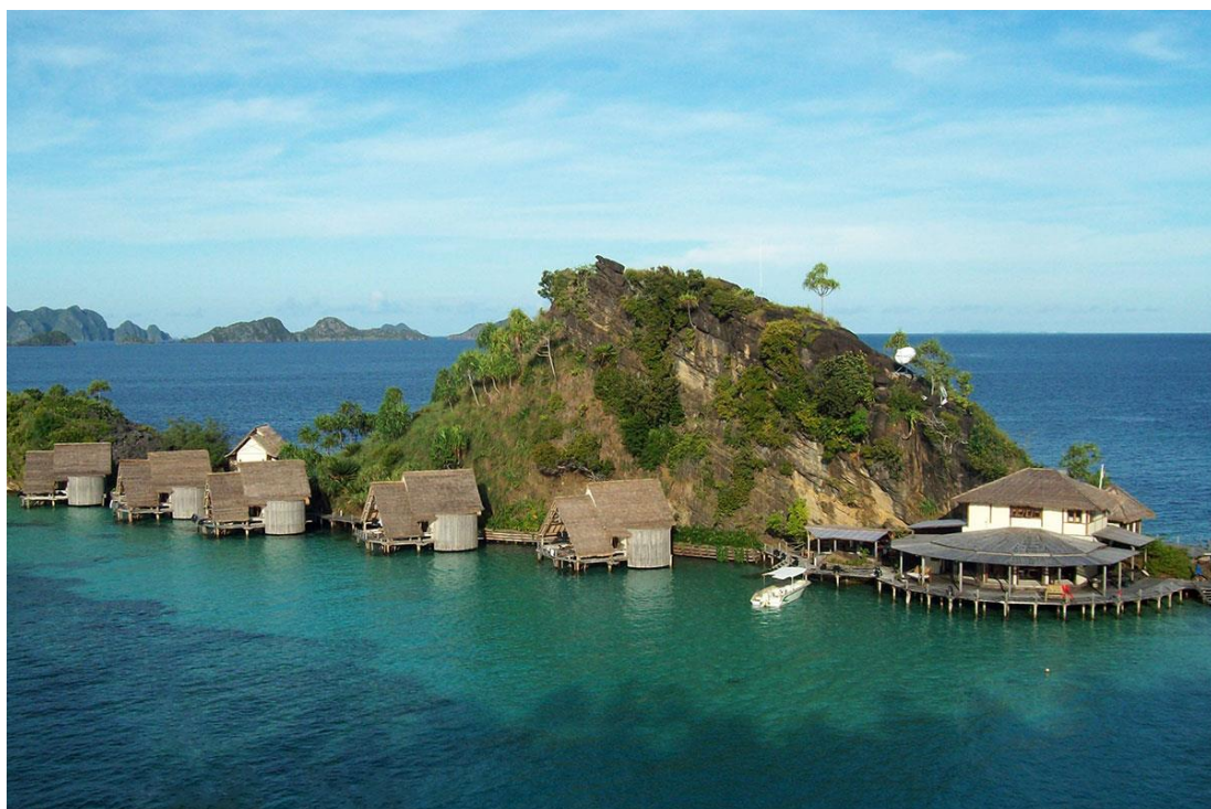
Рис. 1.5. Приватний курорт Misool Eco Resort

Також було створено приватний морський заповідник (який зріс до розміру 300 000 акрів) і включав зону заборони. Оплачувана команда місцевих рейнджерів із 15 осіб (які працюють у дочірній благодійній організації Misool Foundation) патрулює територію та має базовий табір на курорті Misool Eco (поряд із іншими місцями в цьому районі) [15-16]. Фонд Misool також має додаткові проєкти, включаючи спільну програму для припинення полювання на манту в Лакамері (Savu Sea Alliance) [17-20]. Для життєзабезпечення самого екокурорту робота по збереженню також має велике значення, оскільки вона використовує незаймані рифи як головний актив (на курорті є дайвінг-центр) [18]. Робота навіть збільшила цей актив, оскільки протягом 6 років спостерігалось збільшення біомаси на 250% [19-23].