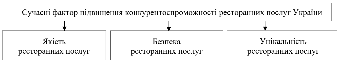
Рис. 3.1. Основні фактори підвищення конкурентоспроможності ресторанних послуг України в сучасних умовах.

Визначення основних факторів підвищення конкурентоспроможності ресторанних послуг є критично важливим для забезпечення успіху та стабільного розвитку галузі в сучасних умовах. Розуміння ролі якості, безпеки та унікальності послуг дозволяє ресторанам адаптуватися до мінливих ринкових умов, задовольняти потреби споживачів та створювати конкурентні переваги. Такі фактори є ключовими для формування позитивного іміджу, підвищення довіри гостей та забезпечення їхньої лояльності [21]. Інноваційний підхід до покращення якості, забезпечення безпеки та створення унікальних пропозицій допомагає ресторанам виділятися на ринку, залучати нових гостей та зберігати провідні позиції у конкурентному середовищі. Зважаючи на зазначене, визначимо основні фактори підвищення конкурентоспроможності ресторанних послуг України в сучасних умовах, що представлено на рис 3.1.