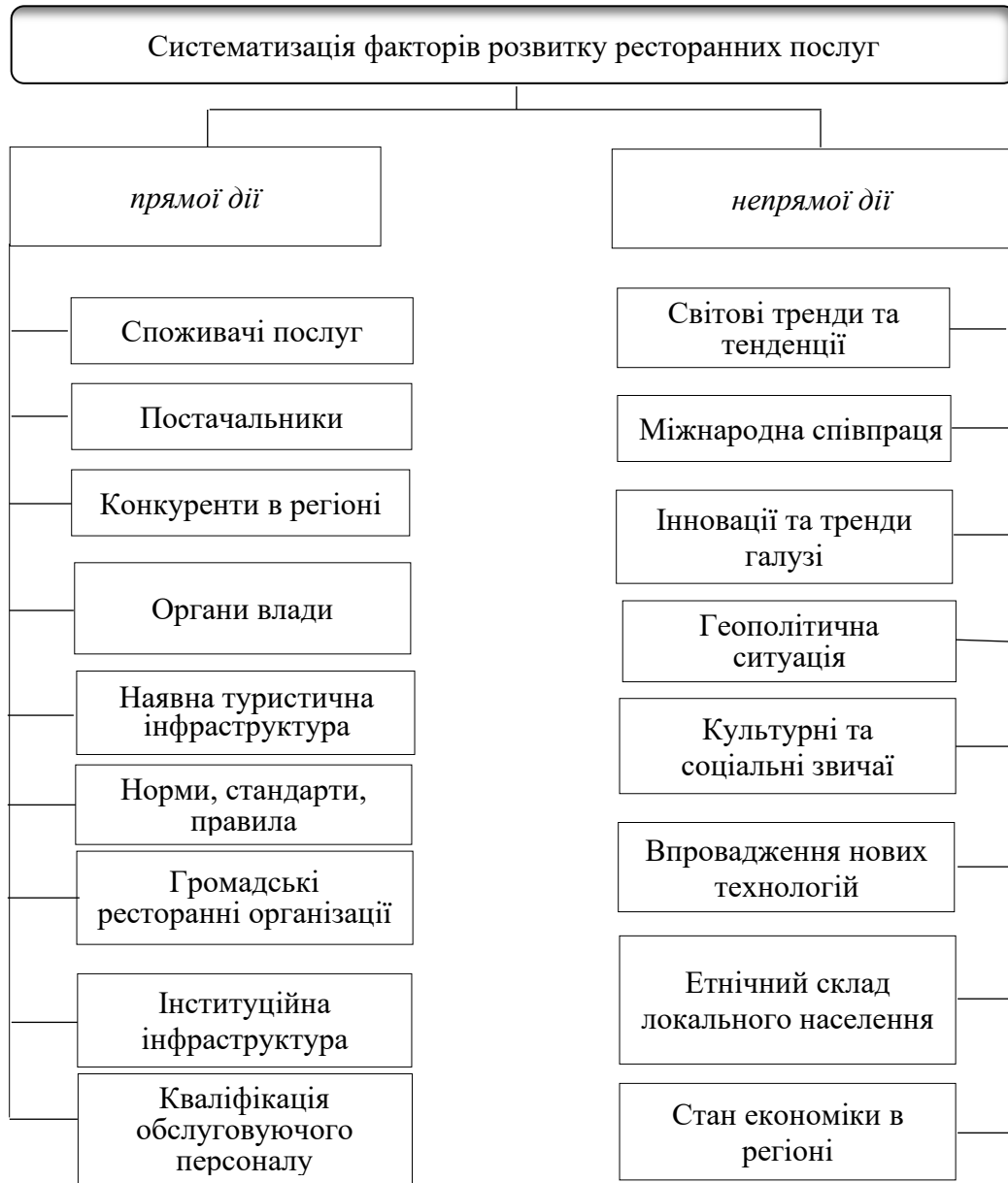
Рис. 1.2. Фактори розвитку ресторанних послуг .

підтримує економічну стійкість країни в складних умовах. Фактори розвитку ресторанних послуг представлено на рис. 1.2.