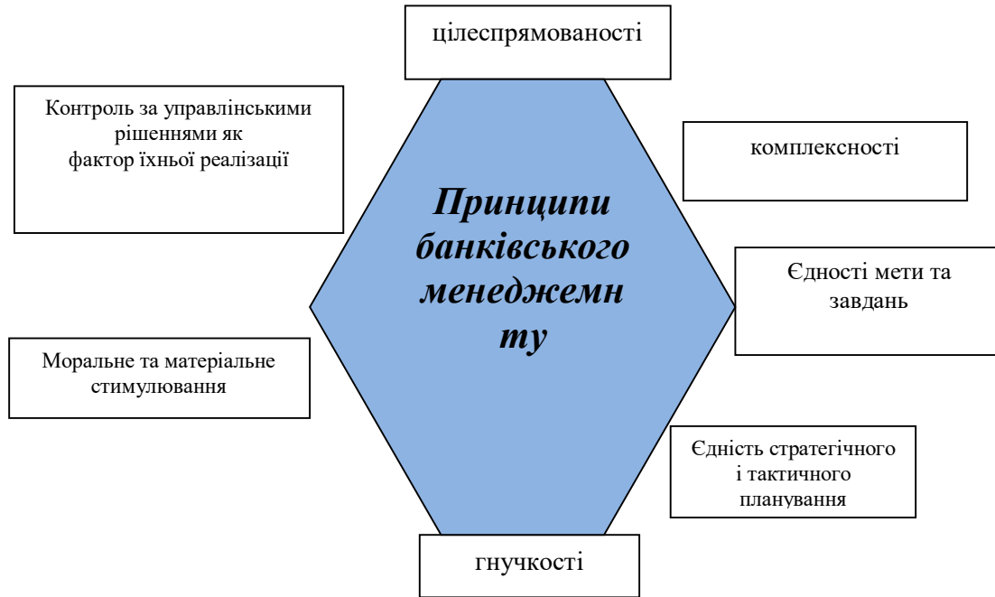
Рис. 2 Загальні принципи банківського менеджменту

управлінський вплив; менеджери, які безпосередньо здійснюють процес управління, тобто менеджмент (керівний склад) банку. Досягнення цілей банківського менеджменту залежить від якості сформованих та побудованих принципів як певних норм та основоположних засад системи управління банком. Водночас банківський менеджмент як наука та специфічний вид менеджменту базується на загальних принципах менеджменту, так і має специфічні принципи побудови. Систематизація загальних принципів банківського менеджменту подана на рисунку 2.