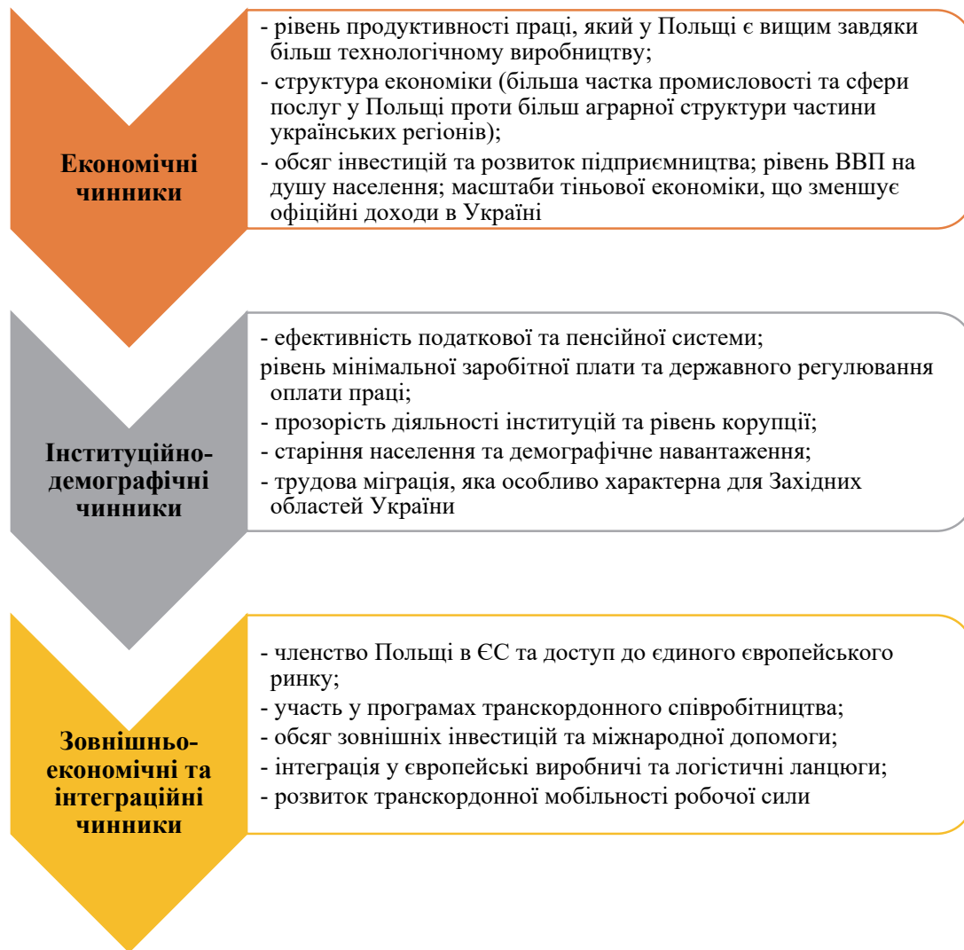
Рис. 3. Основні групи чинників, що впливають на рівень доходів населення польсько-українського прикордоння

та підвищення доходів. Важливим напрямом є участь у програмах транскордонного співробітництва, які активізують локальний розвиток і стимулюють обмін ресурсами. Крім того, обсяги зовнішніх інвестицій і міжнародної фінансової допомоги формують додаткові джерела економічного зростання, посилюючи диференціацію доходів між прикордонними територіями. У сукупності зазначені групи факторів формують складну та ієрархічно організовану систему впливів на рівень добробуту населення регіону.