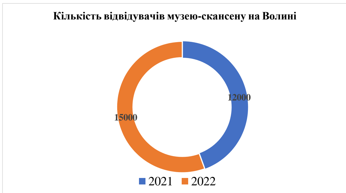
Рис. 3.4. Динаміка туристичних потоків музею історії сільського господарства Волині 2021–2022 рр. (дані приблизні, зі слів працівників музею)

Таким чином, Музей історії сільського господарства-скансен має весь потенціал для ознайомлення туристів з поліськими народними традиціями і, таким чином, збільшення потоку відвідувачів.