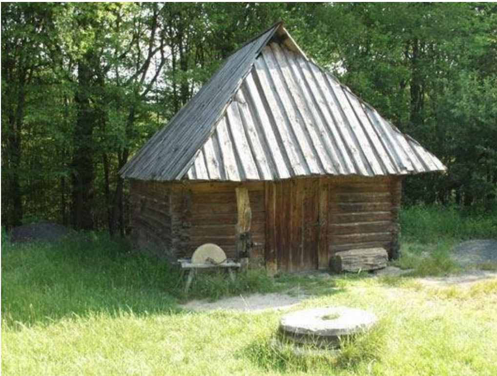
Кузня. 1905 р. с. Залютня Волинської обл.