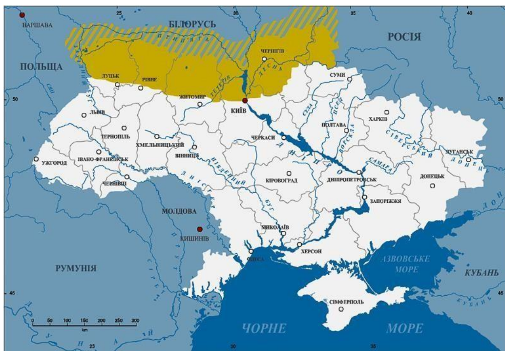
Рис. 2.1 Територія Полісся на карті України

Полісся поділяється на три регіональні групи – лівобережне, центральне та західне – і має дві етнічні групи. Поліщуки в Україні проживають переважно від Любомля, Ковеля, Луцька та Чернігова на північ до кордону з Білоруссю (рис. 2.1). Поліщуки зберігають дуже архаїчну культуру і спосіб життя, успадковані від древлян і північних народів.