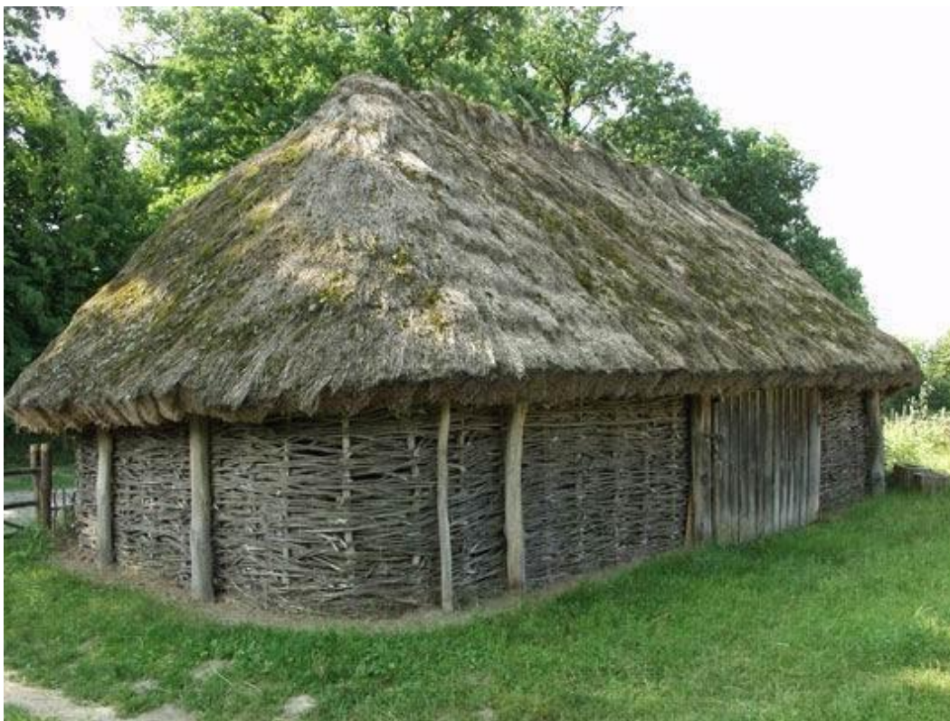
Хлів. Середина ХХ ст. с. Рижки Чернігівської обл.