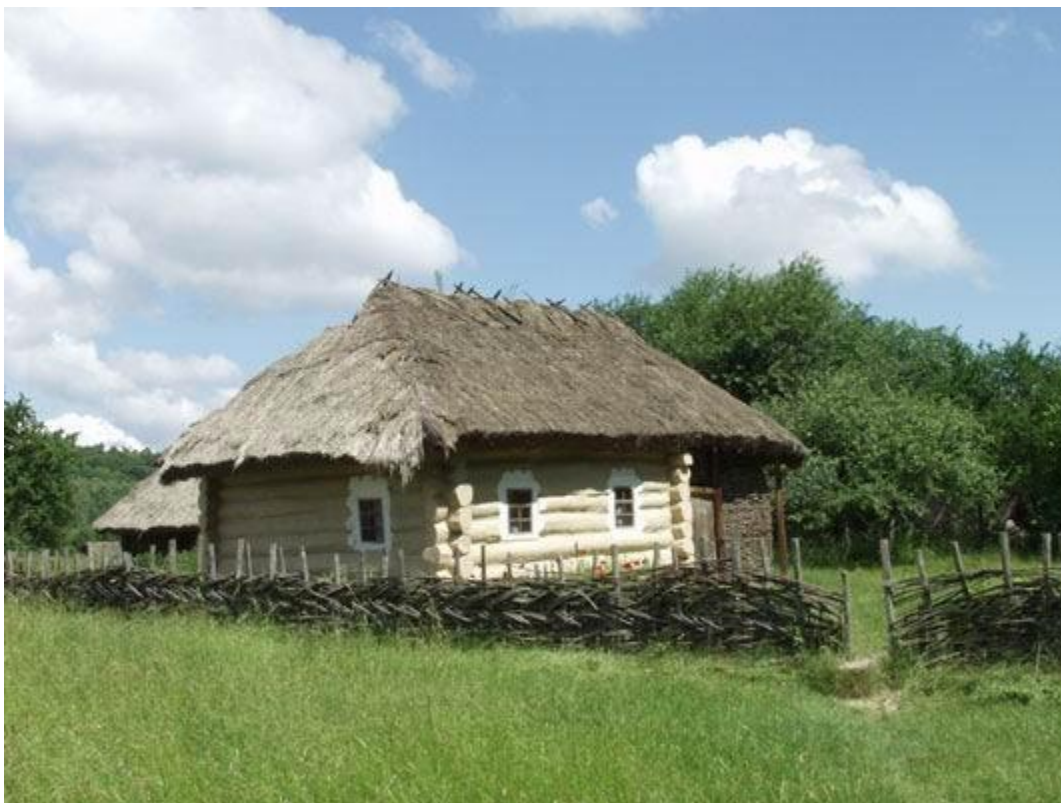
Хата. Кінець XIX ст. с.Мамекине Чернігівської обл.