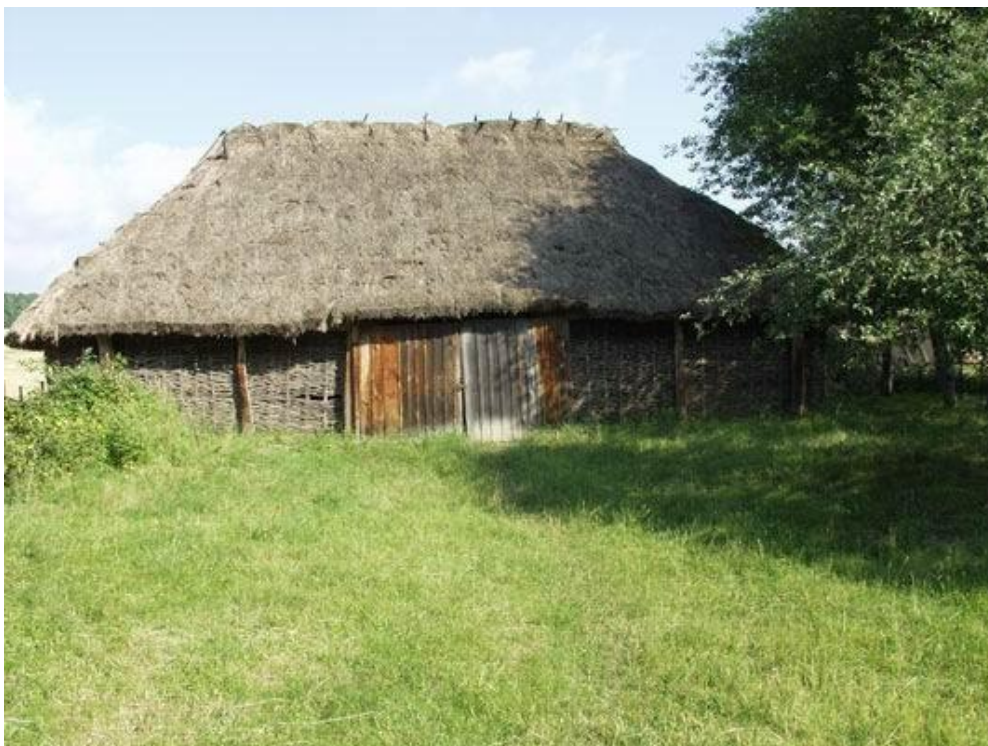
Клуня. Початок XX ст. с. Карацювин Чернігівської обл.