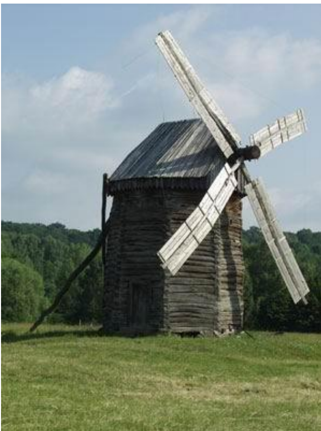
Вітряк. Кінець XIX ст. с. Смолин Чернігівської обл.