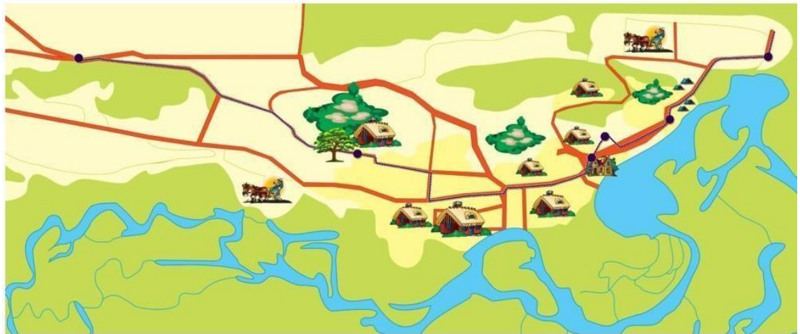
Рис. 3.1. Схема етно-екологічної стежки «Забутими стежками Полісся»

Сваловичі – унікальне село на Волинському Поліссі, яке зберегло свою красу, унікальну історичну цінність та культурну спадщину з мальовничою природою та старовинною поліською архітектурою, а також народними ремеслами, такими як лозоплетіння, вишивка та ткацтво. Навіть сьогодні в селі виробляють власну білизну, тчуть рушники, малюють і зустрічають гостей з розпростертими обіймами. Коли ви в'їжджаєте в село, ви відчуваєте, ніби перетнули межі часу. Як впливає з назви, воно дуже давнє і пов'язане з богом сонця Сварогом. Гуляючи майже безлюдними вуличками, милуючись багатовіковим ландшафтом старих хлівів, плетених парканів, хат, солом'яних стаєнь і колодязів з журавлями, можна сказати, що це не село, а музей. Річка Прип'ять протікає праворуч від вулиці, і половина саду виходить на берег річки. Під час Другої світової війни село було повністю спалене нацистами, які запідозрили присутність партизанів. Однак воно відродилося в автентичному дерев'яному стилі, до якого звикли ще прадіди мешканців села [14].