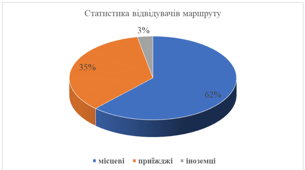
Рис.3.2 Відвідувачі маршруту (згідно даних парку)

Повномасштабна окупація внесла максимальні корективи в роботу парку. Через розташування на кордоні з Білоруссю тут немає справжньої реєстрації відвідувачів та персоналу парку. Але після перемоги парк чекає на туристів, у тому числі й іноземців.