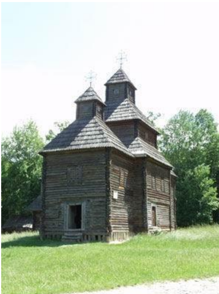
Церква. 1789 р. с. Кисоричі Рівненської обл.