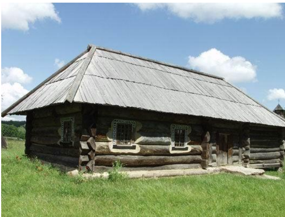
Хата із с. Беги Коростенського р-ну Житомирської обл. Кінець ХVІІІ ст. початок ХІХ ст. рогів