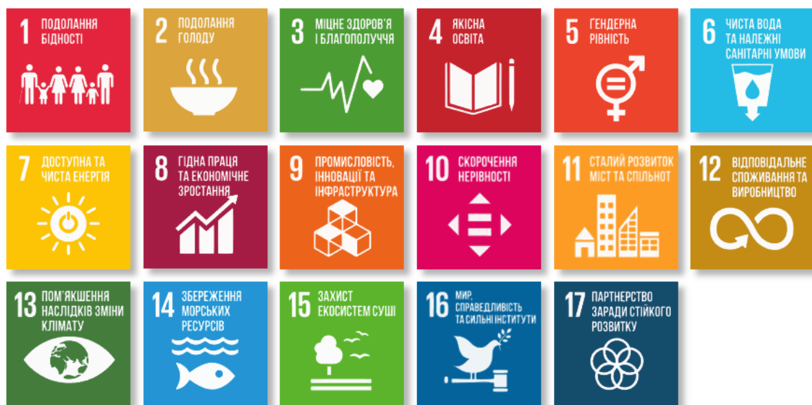
Рис. 1.1. Цілі Сталого розвитку в Україні (джерело: [38])

національних особливостей. Кожна глобальна ціль була переглянута з урахуванням специфіки соціально-економічного розвитку країни, що дозволило сформувати національну систему, яка включає 86 завдань розвитку. 30 вересня 2019 року Президент України підписав Указ «Про Цілі сталого розвитку України на період до 2030 року» [25], яким підтвердив зобов'язання щодо досягнення глобальних цілей та їх адаптації відповідно до внутрішніх умов. Враховуючи особливості розвитку України, адаптація ЦСР стала важливим етапом у формуванні стратегічних пріоритетів держави.