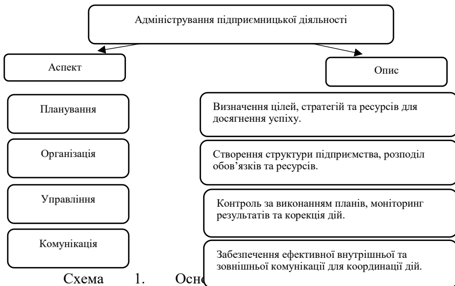
Схема 1. Основні аспекти адміністрування підприємницької діяльності

Представимо схеми, які ілюструють основні аспекти адміністрування підприємницької діяльності та роль капіталу у створенні конкурентних переваг.