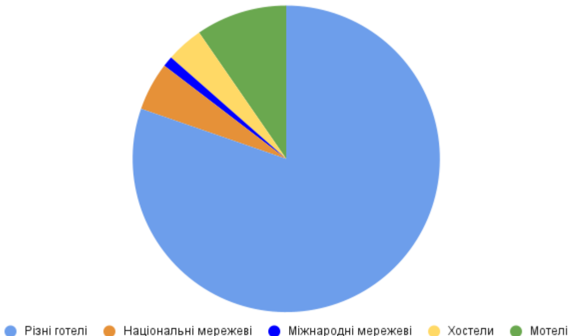
Рис. 1. Структура діючих готелів України у 2024 році

Трансформація готельної індустрії України відбувається під багатофакторним впливом, де поєднуються