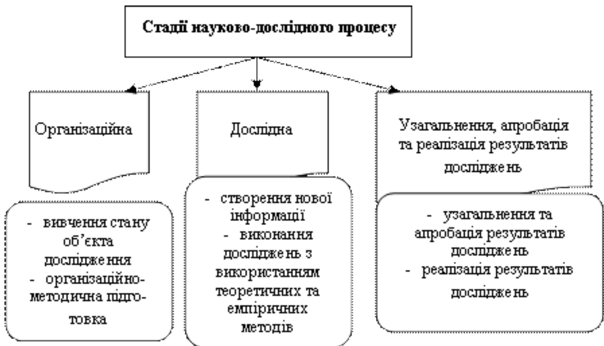
Рисунок 1. Схема науково-дослідного процесу