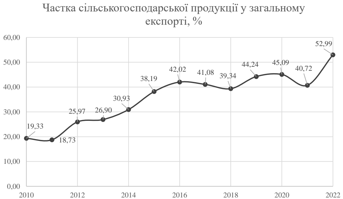
Рисунок 2.1 Частка вартості сільськогосподарської продукції у вартості загальнонаціонального експорту у 2010-2022 роках

походження, готові харчові продукти), у загальному обсязі національного експорту за 2010-2022 роки.