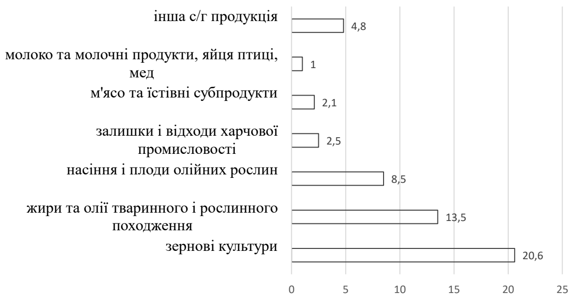
Рисунок 2.2 Частка окремих видів сільськогосподарської продукції у загальному експорті у 2022 році