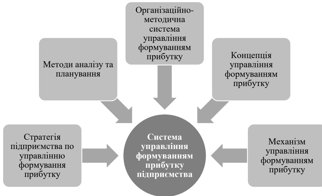
Рис. 1. Складові елементи системи управління формуванням прибутку підприємства Джерело: [3]

здатності впроваджувати інноваційні рішення та оперативно реагувати на зміни ринкової кон'юнктури. Підприємства, які орієнтуються на підвищення ефективності управління та гнучкість у прийнятті управлінських рішень, отримують можливість забезпечувати стабільне зростання прибутковості та зміцнювати конкурентні позиції в умовах сучасного економічного середовища.