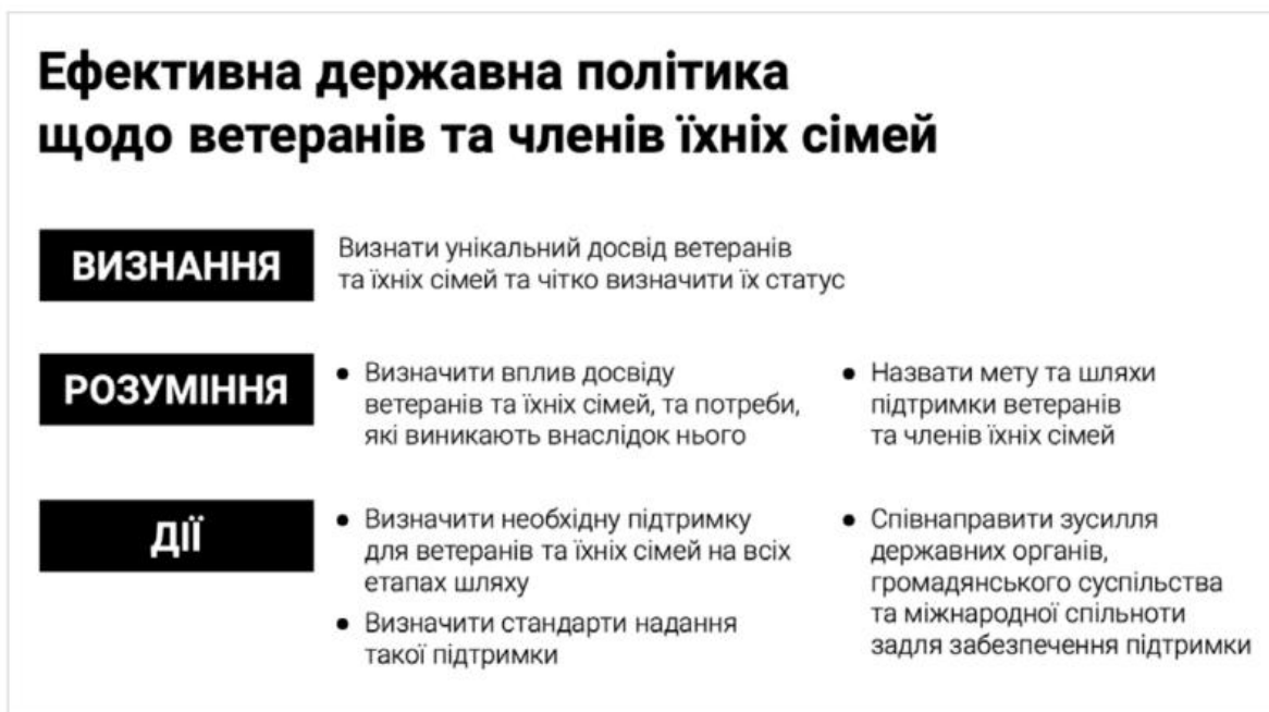
Рисунок 2.2. Концептуальні складові ефективної політики щодо ветеранів та членів їх сімей [33].

дієвості та комплексності політики її формування має відбуватись із залученням всіх зацікавлених сторін з боку держави, громадськості, бенефіціарів та громад [33]. Ефективна державна політика щодо ветеранів передбачає, на думку авторів, визнання, розуміння та дії (див. Рис.2.2.)