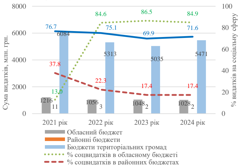
Рис. 1. Динаміка видатків на соціальну сферу у розрізі бюджетів Волинської області за 2021-2024 рр. в перерахунку на ціни на початок 2021 року (побудовано авторами на основі даних (Департамент фінансів, 2025))

Враховуючи те, що у Волинській області функціонує 54 територіальні громади виникає необхідність детальнішого вивчення темпів приросту видатків на соціальну сферу для реалізації програм і проєктів соціального розвитку. З карти (рис. 2) видно, що позитивну динаміку до зростання фінансування соціальних видатків для реалізації програм і проєктів розвитку соціальної сфери забезпечили тільки три громади – Підгайцівська (+8,3%), Боратинська (+1,1%), Вишнівська (+0,4%).